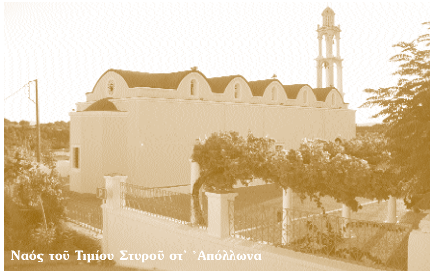
Ναὸς τοῦ Τιμίου Σταυροῦ στ' Ἀπόλλωνα