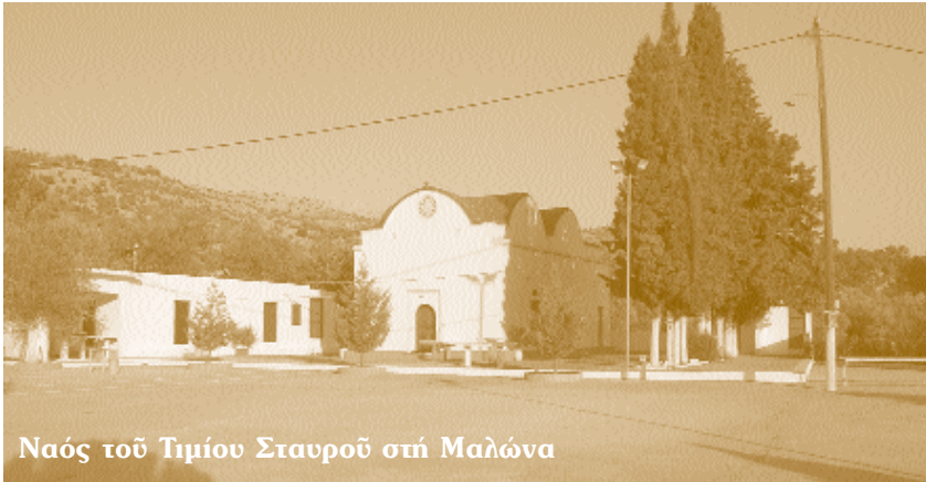
Ναός του Τιμίου Σταυρού στή Μαλώνα

ἐπιγραφή ἀναφέρει «ἀνηγέρθην ἐκ θεμελίων καί ἐτελειοποιήθην ὁ ναός τοῦτος μέ ἔξοδα κι ἐπιστασία τοῦ προσκυνητοῦ Ἑμμανουήλ Ζαρμάου καί τῆς γυναίκος του Μαρίας, Ἀρχιερατεύοντος Ἀγίου Ρόδου Ἰακώβου Πατμίου τό ἔτος 1855».