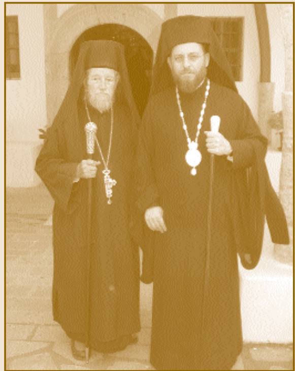
Ὁ μακαριστός Ἀρχιμανδρίτης Βαρθολομαῖος Σιράτας μέ τόν Σεβ. Μητροπολίτη μας

Ἡ Ἐξόδιος Ἀκολουθία ἐψάλη στό Καθολικό τῆς Ἱερᾶς Μονῆς Ὑψηῆς προεξάρχοντος τοῦ Σεβ. Μητροπολίτου μας, ὁ ὁποῖος στήν ἐπικήδειο ὁμιλία του ἐξῆρε τό ἦθος τοῦ ἐκλιπόντος καί τήν προσφορά του στήν Ἱερά Μονή. Στήν Ἐξόδιο Ἀκολουθία ἔλαβε μέρος ὁ Σεβασμιώτατος Μητροπολίτης Νέας Ζηλανδίας κ. Ἀμφιλόχιος, παρέστη δέ ὁ Καθηγούμενος καί Πατριαρχικός Ἐξάρχος Πάτμου κ. Ἀντίπας.