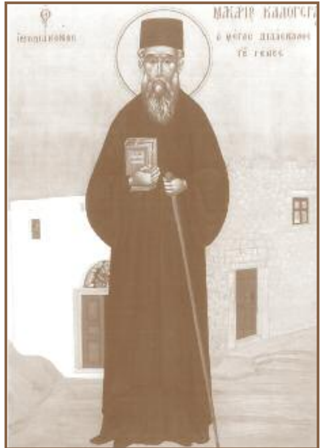
Ὁ Ἅγιος Μακάριος ὁ Καλογεράς. Φορητή Εἰκῶν εὐρισκόμενη εἰς τήν Ἱεράν Μονήν Πάτμου. (Χεῖρ Βαΐου Τσουλκανάκη 1994)

Ὁ Μακάριος δίδασκε δωρεάν καί οἱ πρῶτοι μαθητές φοίτησαν ἐπτά χρόνια. Ἀρχικά ἔζησε «λιμῶ καί ἐρημία», ὅπως ἀναφέρει ὁ ἴδιος. Οἱ πολλές στερήσεις του, ὅμως, πνίγονταν στό μεγάλο πέλαγος τῆς ἀγάπης του πρός τήν Ἐκκλησία καί τῆς πίστεως του στήν ἀνάγκη τῆς παιδείας τοῦ γένους 7 .