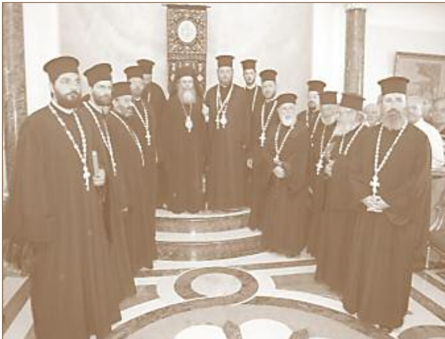
ΜΕ ΤΟΝ ΜΑΚΑΡΙΩΤΑΤΟ ΠΑΤΡΙΑΡΧΗ ΙΕΡΟΣΟΛΥΜΩΝ