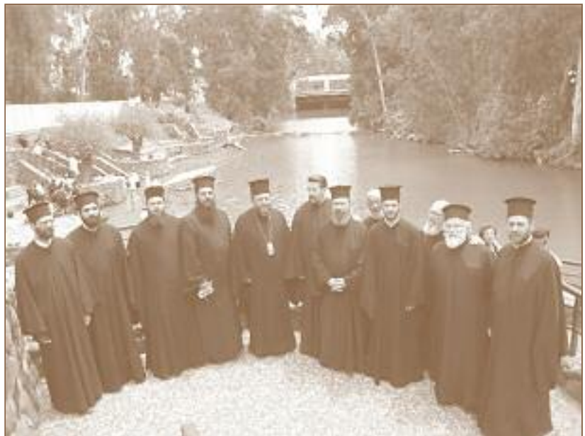
ΣΤΟΝ ΙΟΡΔΑΝΗ ΠΟΤΑΜΟ

Ἡ τελευταία μέρα, πρὶν τήν ἐπιστροφή, μᾶς ἐπιφύλασσε τήν ιδιαίτερη εὐλογία νά πάρουμε τήν εὐχή του Μακαριωτάτου Πατριάρχου Ἱεροσολύμων κ.κ. Θεοφίλου. Στόν λόγο του ἀπλός, στούς τρόπους προσηνής, στό πρόσωπό του ζωγραφισμένη ἡ ἀγωνία γιά τή λει-