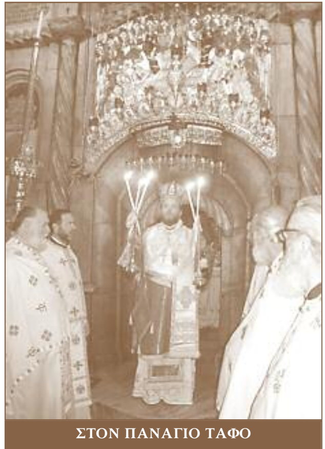
ΣΤΟΝ ΠΑΝΑΓΙΟ ΤΑΦΟ

Ἀκολουθήσαμε τὰ βήματα τοῦ Ἰησοῦ προσκυνώντας