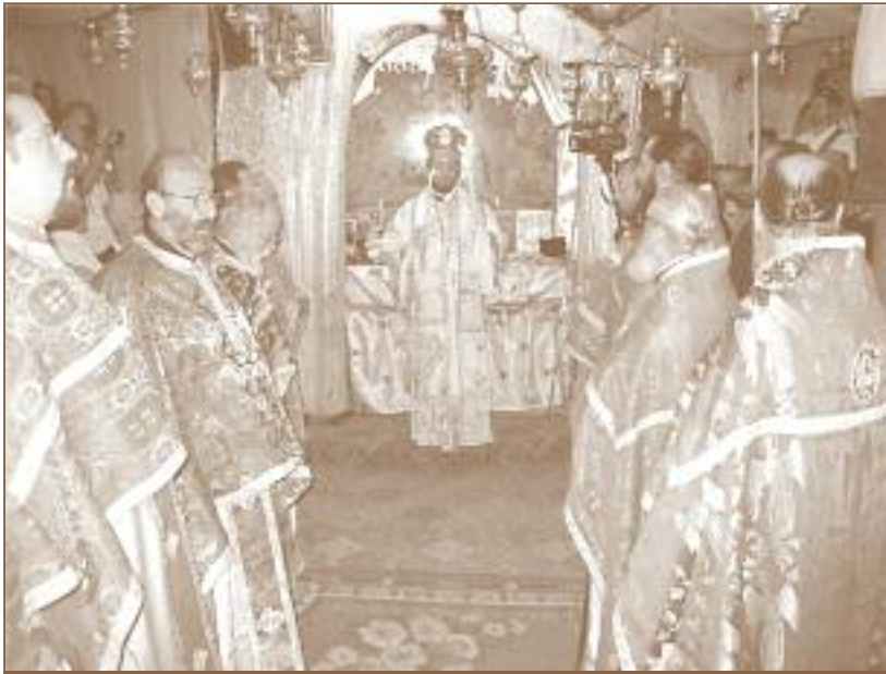
ΣΤΟ ΣΠΗΛΑΙΟ ΤΗΣ ΓΕΝΝΗΣΕΩΣ ΣΤΗ ΒΗΘΛΕΕΜ

άσυγκίνητοι, αναλογιζόμενοι ότι στο σημείο αυτό γεννήθηκε από την Παρθένο Μαρία ο Ήσους μας Χριστός. Στο δεξιό μέρος του Σπηλαίου είδαμε την Άγια Φάτνη, όπου σύμφωνα με την παράδοση τοποθέτησε η Παναγία τον νεογέννητο Χριστό πάνω σε άχυρα για να ζεσταθεί.